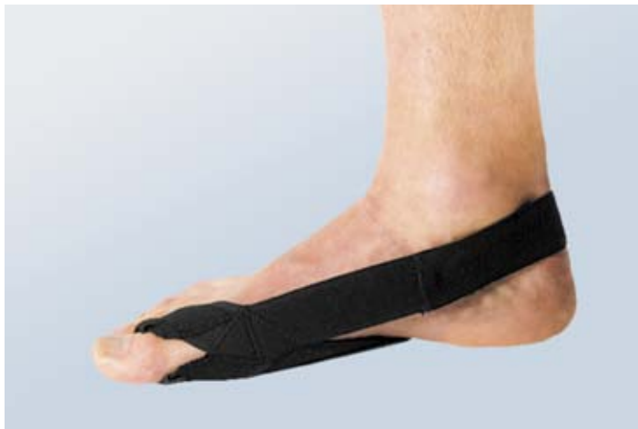
Hallux Valgus Comfort T

Ansprechpartnerin: Sonja Jäkle 044 266 61 71 info@baehler.com