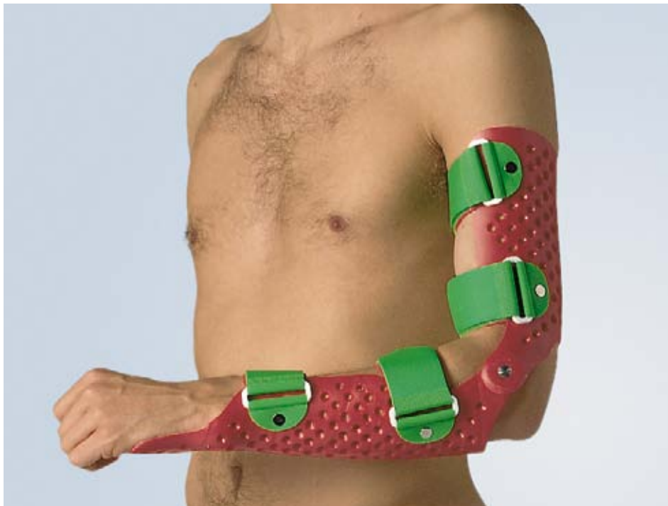
Oberarmorthese mit frei beweglichem Gelenk

Leicht irreführend ist die Bezeichnung dieser funktionellen Orthesenversorgung. Könnte man aufgrund dieser auf Verletzungsmuster im Bereich des Oberarms schliessen, findet diese Schienenart ihren Einsatz viel mehr bei Verletzungen im und um den Ellenbogen.