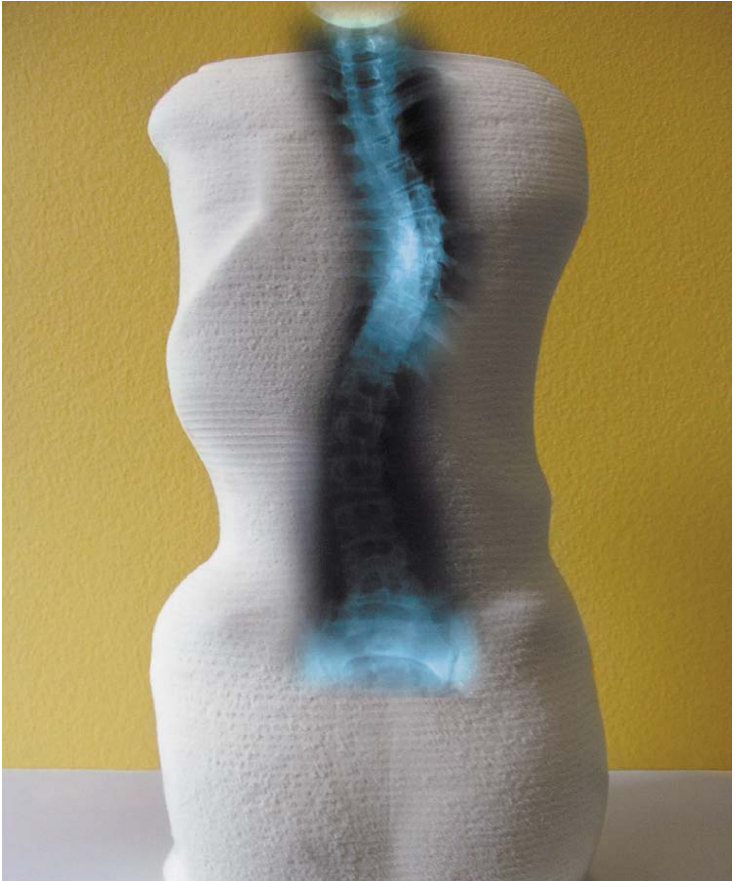
Schaummodell mit projizierter, unkorrigierter Wirbelsäule