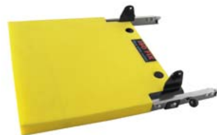
Iso-Fix-Base-Basisplatte für Carrotsitze