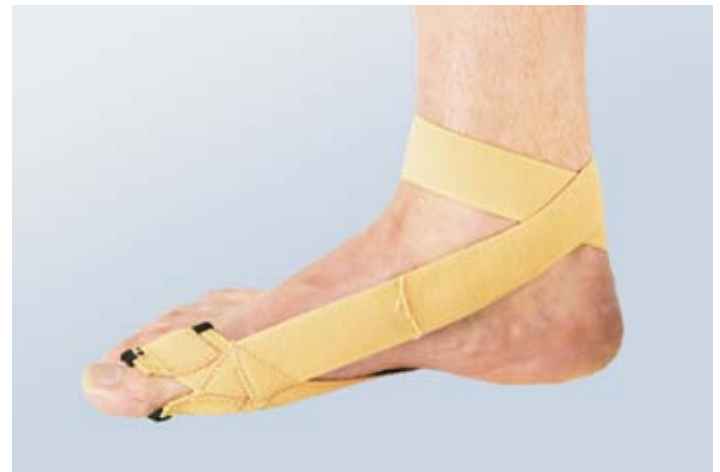
Hallux Valgus Combo

Leichter und flexibler Gurt, gefüttert, kann mit oder ohne Schuhe getragen werden.