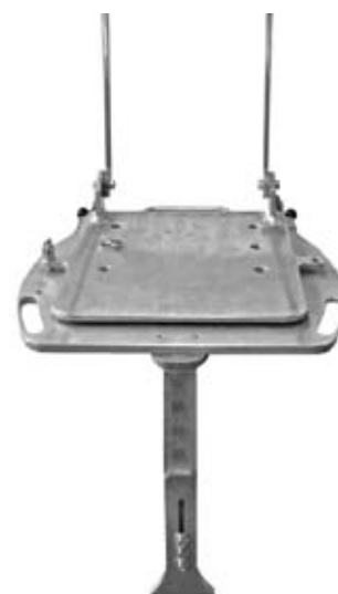
Iso-Fix-Turn-Drehteller für Carrotsitze